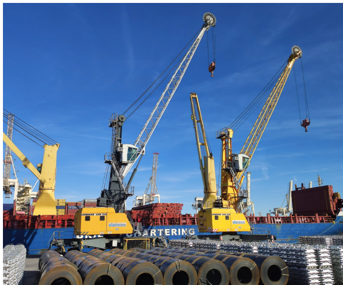
Celo uro smo se z avtobusom vozili med žerjavi, kontejnerji, skladišči... v ogromni Luki Koper