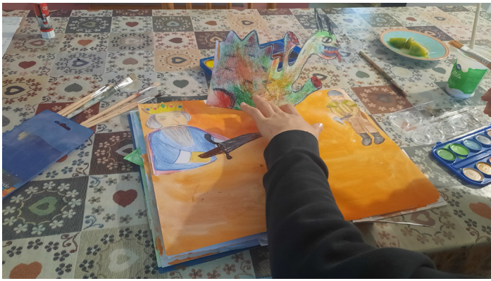
Pravljičica o zmaju pod Raduho

in ljudskega izročila. Programe bomo popestrili z risanjem planinskih fraktalov.