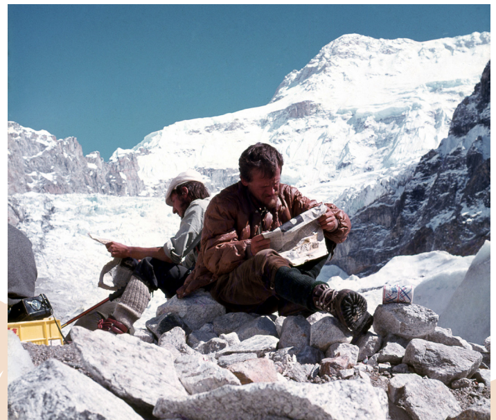
Mojstranški veverici v baznem taboru

V letu 2025 pa praznujemo 60. obletnico prve odprave na Kangbačen, ko je druga jugoslovanska alpinistična odprava dosegla za tiste čase najvišjo točko nadmorske višine Koto (danes Zahodni Kangbačen oz. Jalung Ri) in našla ključ do rešitve pristopa in vzpone čez ledenik Ramtang.