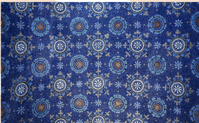
Mozaik iz Ravene

Ravena je danes pomembno industrijsko središče na Jadranu. Nekoč pa je bila osrednje pristanišče. Gradnja povezovalnih kanalov je mestu, ki leži sredi močvar reke Pad, omogočila varnost. Leta 402 je Ravena postala glavno mesto Zahodnega rimskega cesarstva in središče kulturnega in gospodarskega življenja. Je svojevrsten spomenik krščanske umetnosti, znana je