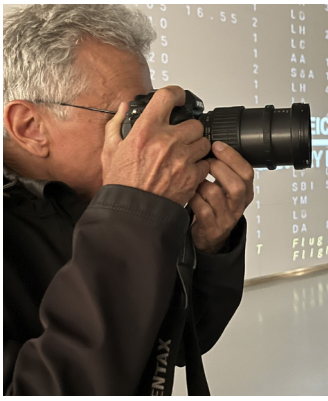
Vitomir Pretnar kot fotograf, osebni arhiv Vitomirja Pretnarja.