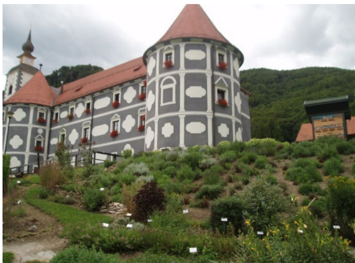
Župnijska cerkev Marijinega Vnebovzetja, Olimje