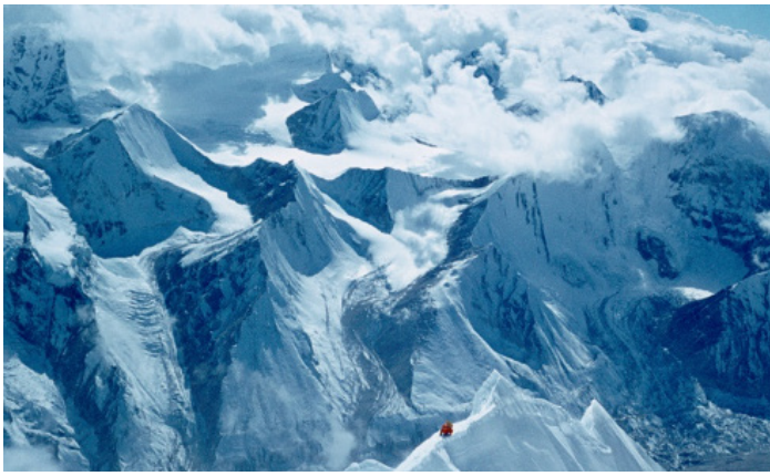
Pogled na Himalajo, foto: Janez Dovžan

7902 m visoko goro, ki stoji na tromeji Nepala, Tibeta in Indije. Kljub prežvečeni, takrat dosegljivi literaturi himalajskih vzponov in Tibeta je doživetje močno presešlo pričakovanja in zastrupitev, zasvojenost je nastopila trajno. Tako mi je bilo dano v naslednjih letih ponovno obiskati Nepal in stopiti še na dva mogočna vrhova: Makalu, 8464 m in Amu Dablam, 6950 m.