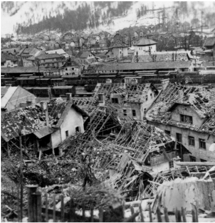
Jesenice po zavezniškem bombardiranju 1. 3. 1945

Udeleženci kviza se bodo seznanili z različnimi vidiki okupacije, na finalu, ki bo potekalo 17. marca 2025 v Kinu Železar, pa bodo za priznanja in nagrade tekmovali tisti učenci in učenke, ki bodo na šolskih tekmovanjih pokazali največ znanja.