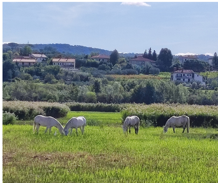
Sprehod po naravnem rezervatu Škocjanski zatok (kamarški konji): Ali se dovolj zavedamo bogastva in raznolikosti narave?