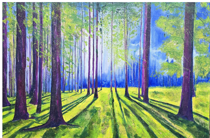
Gregor Pratneker, Poletje gozda , 2024, olje na platnu, 100 x 150cm.

V poletje nas bo popeljala razstava mariborskega umetnika Gregorja Pratnekerja, ki bo na ogled od 19. 6. 2025 pa vse do prvih dni septembra. Gregor Pratneker (1973) se je s slikarstvom začel ukvarjati v devetdesetih, v zadnjem obdobju pa se posveča predvsem krajinam. Kot je zapisala Breda Kolar Sluga, je narava, še posebej gozd prostor čudes, strahu in upanja, saj je del njegovega vsakdana že od otroštva.