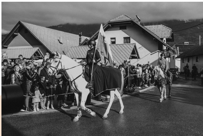
Blagoslov konj na Blejski Dobravi 26. decembra 2023

V lanskem letu smo v Gornjesavskem muzeju Jesenice na Koordinatorja varstva nesnovne kulturne dediščine naslovili pobudo za vpis žegnanja konj na Štefanovo v Register nesnovne kulturne dediščine Republike Slovenije in se pred kratkim razveselili obvestila, da: »prijavljeni element nesnovne kulturne dediščine odgovarja merilom in je zato primeren za vpis v Register nesnovne kulturne dediščine. O vpisu enote v Register boste pisno obveščeni«.