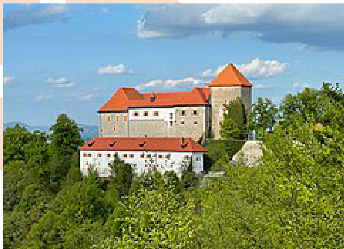
Grad Podsreda

Krenili bomo ob 7. uri s Hrušice - AP Dobrnjnik. Kot vedno, se bomo najprej ustavili na enem od počivališč in se primerno okrepčali, nato pa pot nadaljevali v smeri proti robu Kozjanskega parka. Prva točka našega izleta bo tokrat ogled »najbolj grajskega med gradovi na Slovenskem« (priponko je dobil zaradi skoraj neokrnjenega srednjeveškega videza) gradu Podsreda., ki mu pripada posebno mesto med gradovi na območju Kozjanskega parka, saj z bogato kulturno dejavnostjo živi tudi danes. Je eden redkih kulturnih spomenikov romanske dobe, ki je v zadnjih tridesetih letih iz skoraj propadajočega stanja skozi celovito prenovo postal pomemben nosilec kulturne, izobraževalne, družabne in turistične ponudbe v tem delu Slovenije.